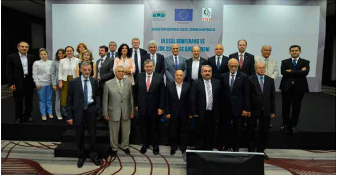
2014 Yılı Ödül Töreni'nden...